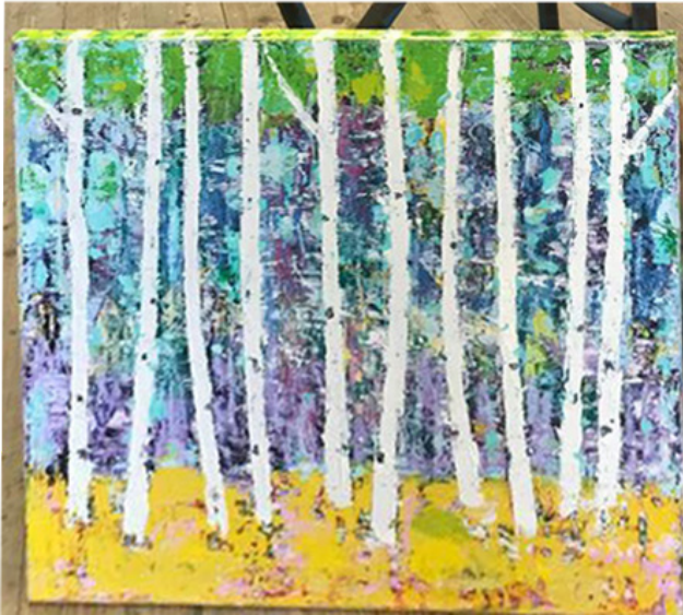
Birkenwald, 70x70 cm, 2019 700€