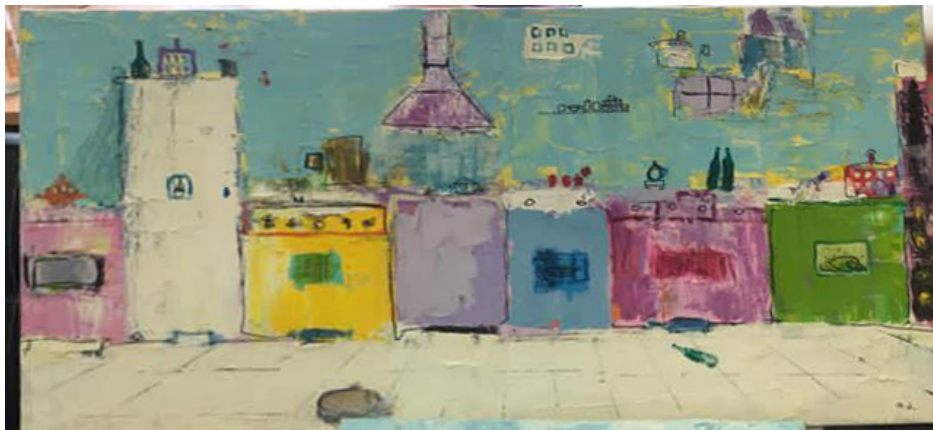
Küche, 110x65, 2020 1200€