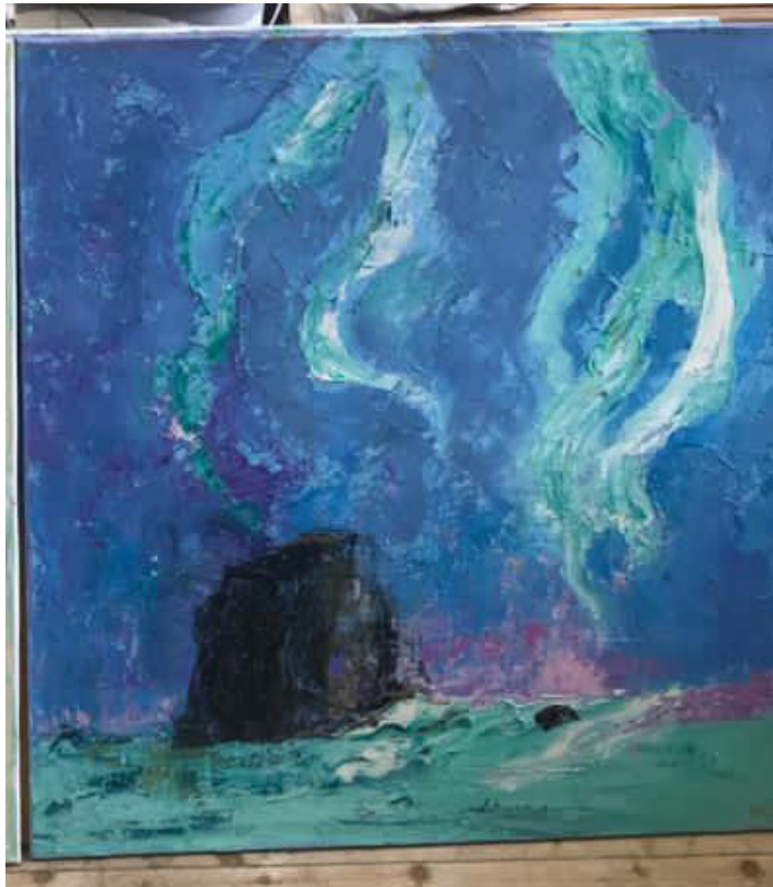
Dämmerung, 100x100 cm, 2020 1200€