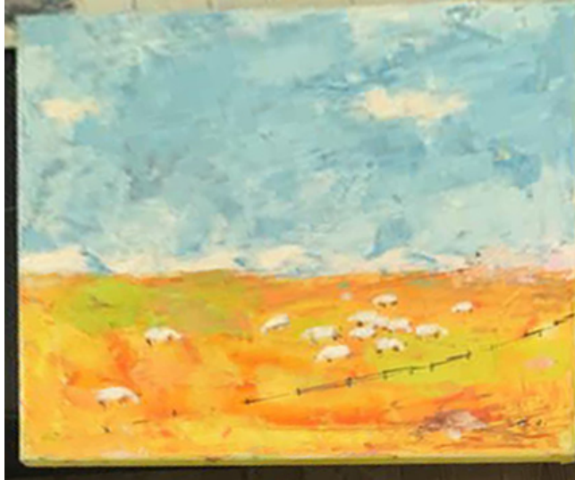
Bauernhof (Niederbayern), 80x80 cm, 2020 700€